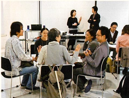
昨年のディスカッションの様子