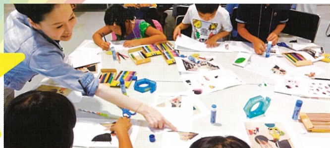
創作活動(昨年の様子)