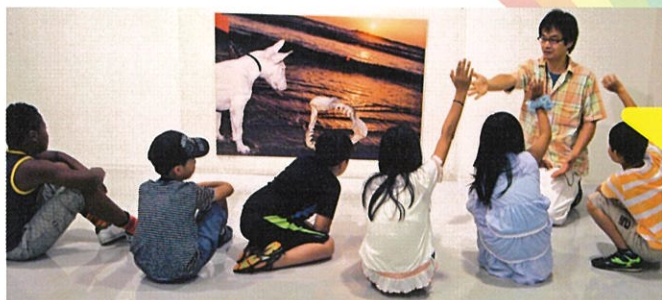
対話型鑑賞(昨年の様子)