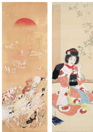
(左から) 菅橋彦《赤日浪速人》1955年 大阪中之島美術館蔵 | 島成園《舞妓之図》1916年頃 個人蔵

* 2023年1月から開催予定の「サラ・モリス展（仮称）」は国際的情勢により開催延期となりました。新たな開催時期が決まりましたら、当館ホームページにてお知らせいたします。