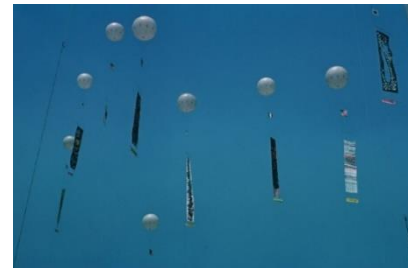
「インターナショナル スカイ フェスティバル」風景 1960年

* 荒天の場合、日程が変更となります。その場合は当館公式ホームページでお知らせいたします。