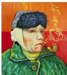
森村泰昌《肖像（ファン・ゴッホ）》 1985年 大阪中之島美術館蔵 ©Yasumasa Morimura