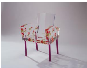
倉俣史朗《Miss Blanche（ミス・ブランチ）》 デザイン1988年 / 製作1989年 大阪中之島美術館蔵 ©Kuramata Design Office