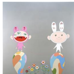
村上隆《Red Rope》2001年 高松市美術館蔵 ©Takashi Murakami / Kaikai Kiki Co., Ltd.