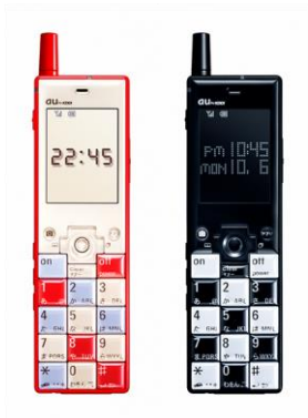
深澤直人《INFOBAR》 2003年 KDDI株式会社蔵 ©KDDI CORPORATION