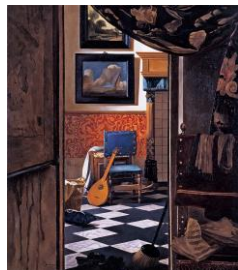
小川信治《恋文》 2006年 高松市美術館蔵