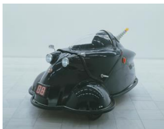
ヤノベケンジ《アトムカー（黒）》 1998年 国立国際美術館蔵