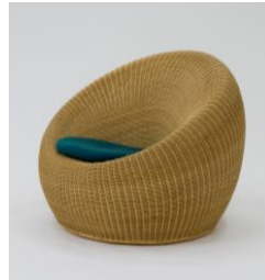
剣持勇《ラウンジチェア》 1958年（発売：1960年 再製作：1972年） 武蔵野美術大学 美術館・図書館蔵