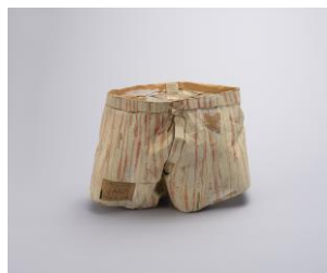
日比野克彦《PANTS》 1981年 岐阜県美術館蔵 ©KATSUHIKO HIBINO