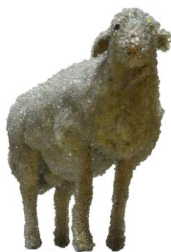
名和晃平《PixCell-Sheep》 2002年 和歌山県立近代美術館蔵 ©Kohei Nawa