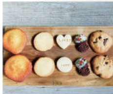
unimu(ゆにむ) 米粉のスイーツ