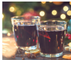
ミュゼカラト ホットワイン