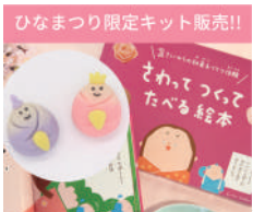
ひなまつり限定キット販売!! 大徳屋長久 さわってつくってたべる絵本 (体験型絵本和菓子キット)