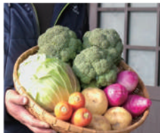
滋賀県 心虹 farm「こごふあーむ」 新鮮とれたて野菜