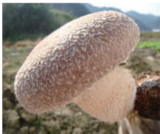
徳島県 高野さのこブランド 天恵菇 (オーガニックしいたけ)