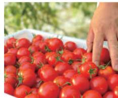
滋賀県 ROPPO アイメックマト