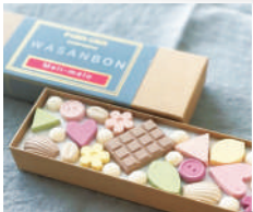
パブリックコンフィズリー 和三盆とアーモンド菓子