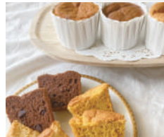
HUG お米の甘酒シフォン