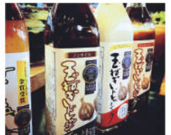
滋賀県 Vege Rice-べじらいす- 玉ねぎドレッシング