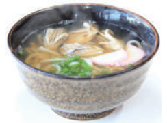
高橋家 牡蠣そば・うどん