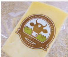
OTOMOYA Lab. レーベンの手作りチーズ