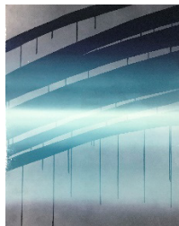
《対岸》 2023年 116.7×91.0cm