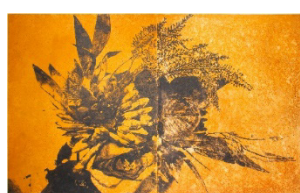
《Flower without bloom / 咲かない花束》 2021年 162.0×260.0×4.8cm