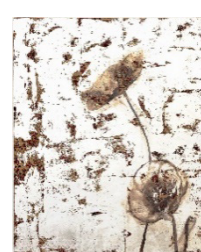
《[Silver] Poppy-04》 2022年 60.6×50.0×2.0cm