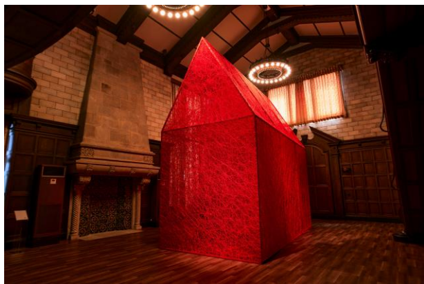
塩田千春《家から家》2022年