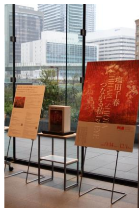
大阪中之島美術館 2階 「塩田千春展」応募ボックス

大阪市総合コールセンター 06-4301-7285（8：00-21：00、年中無休）