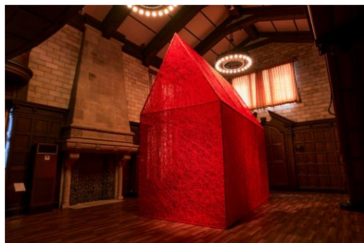
【3】塩田千春《家から家》2022年