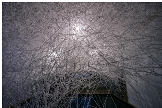
【1】塩田千春《巡る記憶》2022年