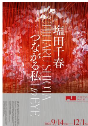
【4】先行チラシビジュアル