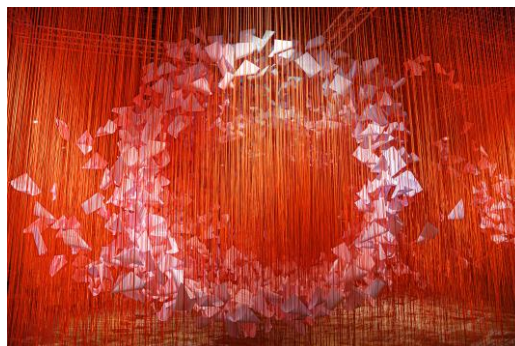
【2】塩田千春《The Eye of the Storm》2022年