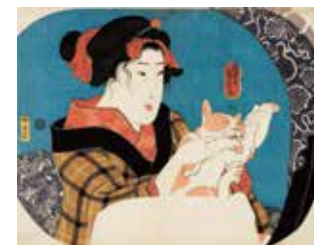
歌川国芳《镜面系列 与猫嬉戏的女孩》 弘化2年(1845)左右

江戸末期的浮世绘师歌川国芳(1797-1861)因其奇特的创意和新颖的设计而闻名于世,在日本国内外享有很高的人气。本展是国芳展的决定版,将展出约300件作品,其中包括武者绘和戏画等多种题材的浮世绘版画和珍贵的亲笔画等。