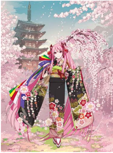
メインビジュアル「桜ミクが舞う。醍醐の桜AR」

「醍醐寺 国宝展」と「桜ミク」がコラボしたスペシャルバージョンで展開。今回のためにイラストレーターのiXima氏が特別に書き下ろした桜ミクのイラストは、大阪中之島美術館の黒い建物をイメージした黒地に、醍醐寺を象徴する五七の桐の紋をあしらった着物を着用。背景には、醍醐寺の有名な枝垂れ桜と国宝の五重塔が描かれています。