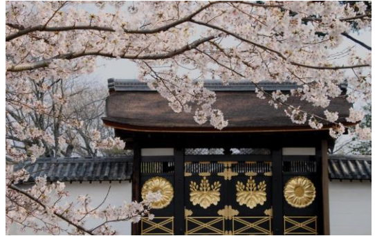
国宝 醍醐寺唐門と桜