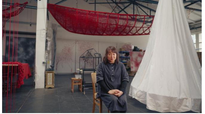
アトリエで自作を語る塩田千春