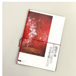
スペシャルブックレット