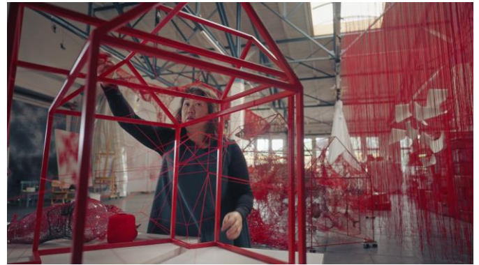
アトリエでの制作風景