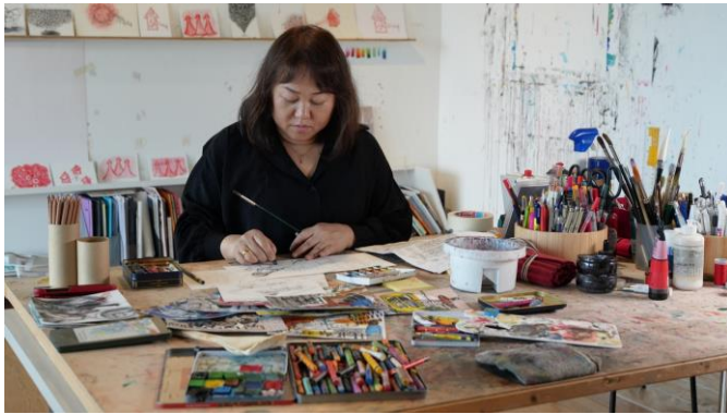
アトリエでの制作風景