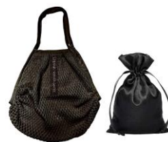
メッシュバッグ&巾着