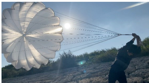
《重力と虹霓 こうばい 》2021年