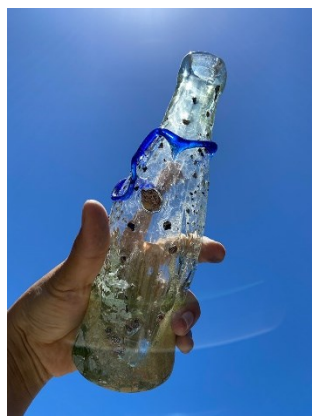
《火炎瓶/ コーラ/ 沖縄/ 1945》2021年