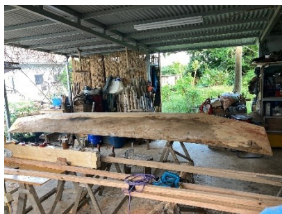
本展展示作品製作風景