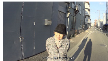
《行旅死亡人(N34° 38' 1" E135° 6' 17")》 2019年 映像 13分