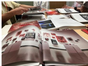
色出しにこだわった制作作業