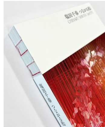
赤い糸綴じがポイントの背表紙