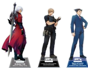
アクリルスタンド 各種 1,980円(税込)