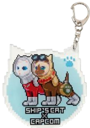
大カプコン展×ヤノバケンジ “SHIP'S CAT (Muse)” アクリルキーホルダー 880円(税込)

大阪中之島美術館のシンボル “SHIP'S CAT (Muse)”に なりきったアィルーがかわいらしい アクリルキーホルダー。