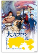
クリアポスター(A3) 990円(税込)

メインビジュアルを使った、透 明感が美しいA3サイズのポスター。 紙にない質感が魅力です。