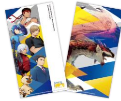
チケットホルダー 660円(税込)

グッズのお持ち帰りに最適な大 容量のスーベニアバッグ。水にも 強く、上部にはファスナー付き。