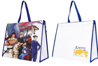
スーベニアバッグ 1,210円(税込)

メインビジュアルを使った、透 明感が美しいA3サイズのポスター。 紙にない質感が魅力です。