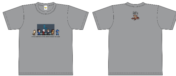
Tシャツ (グレー/Osaka edition) 4,400円(税込)

大阪中之島美術館のシンボル “SHIP'S CAT (Muse)”に なりきったアィルーがかわいらしい アクリルキーホルダー。