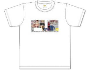
Tシャツ (ホワイト/Osaka edition) 4,400円(税込)

大阪中之島美術館の前を颯爽と行進 するドット絵のキャラクターたちが ポップなTシャツ。背面の襟元にはリオ レウスと大カプコン展のロゴ入り。