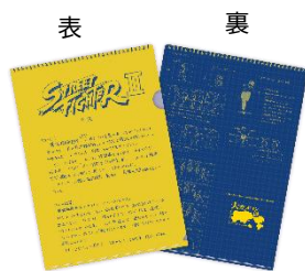
A4クリアファイル (ストリートファイターII 企画書) 440円(税込)