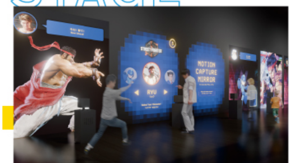
モーションキャプチャーミラー