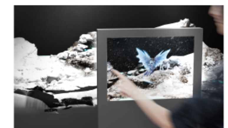
モンスターハンター 超立体図鑑