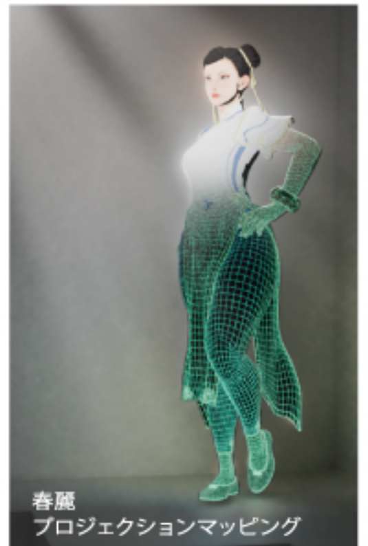
春麗 プロジェクションマッピング