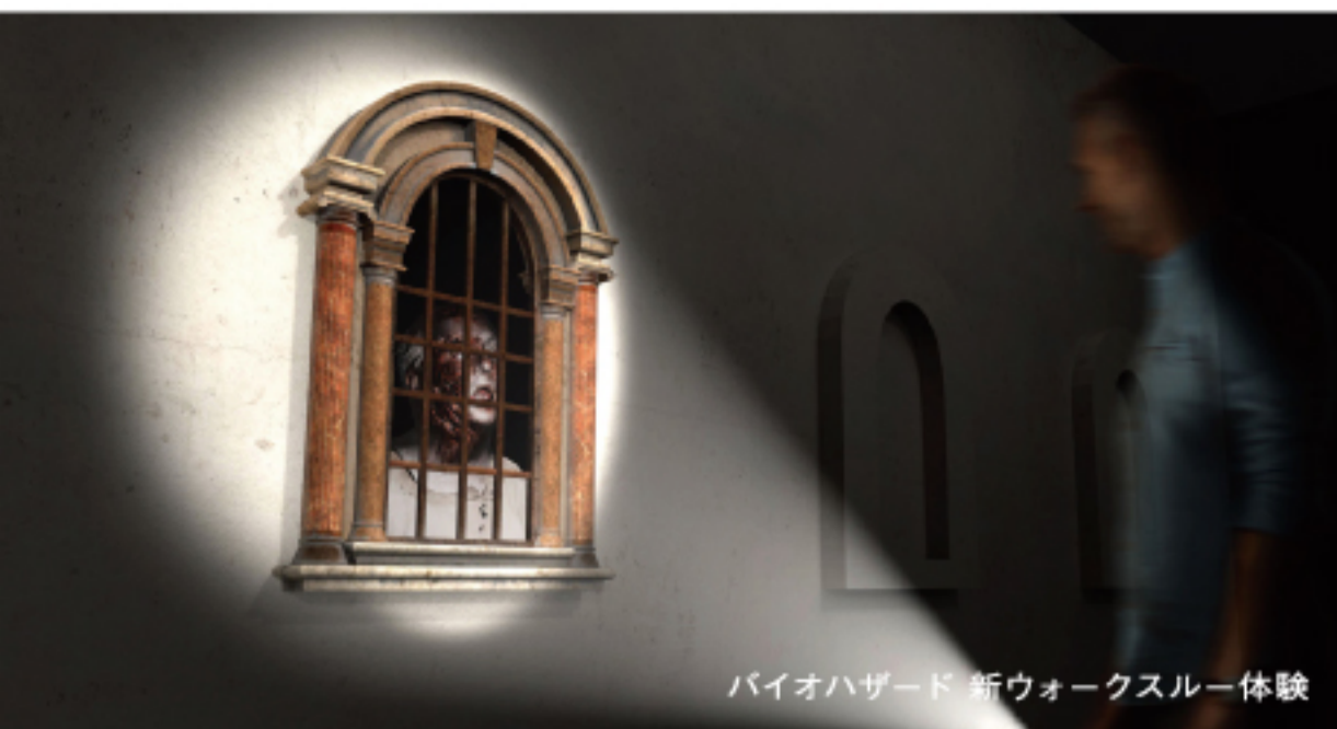
バイオハザード 新ウォークスルー体験