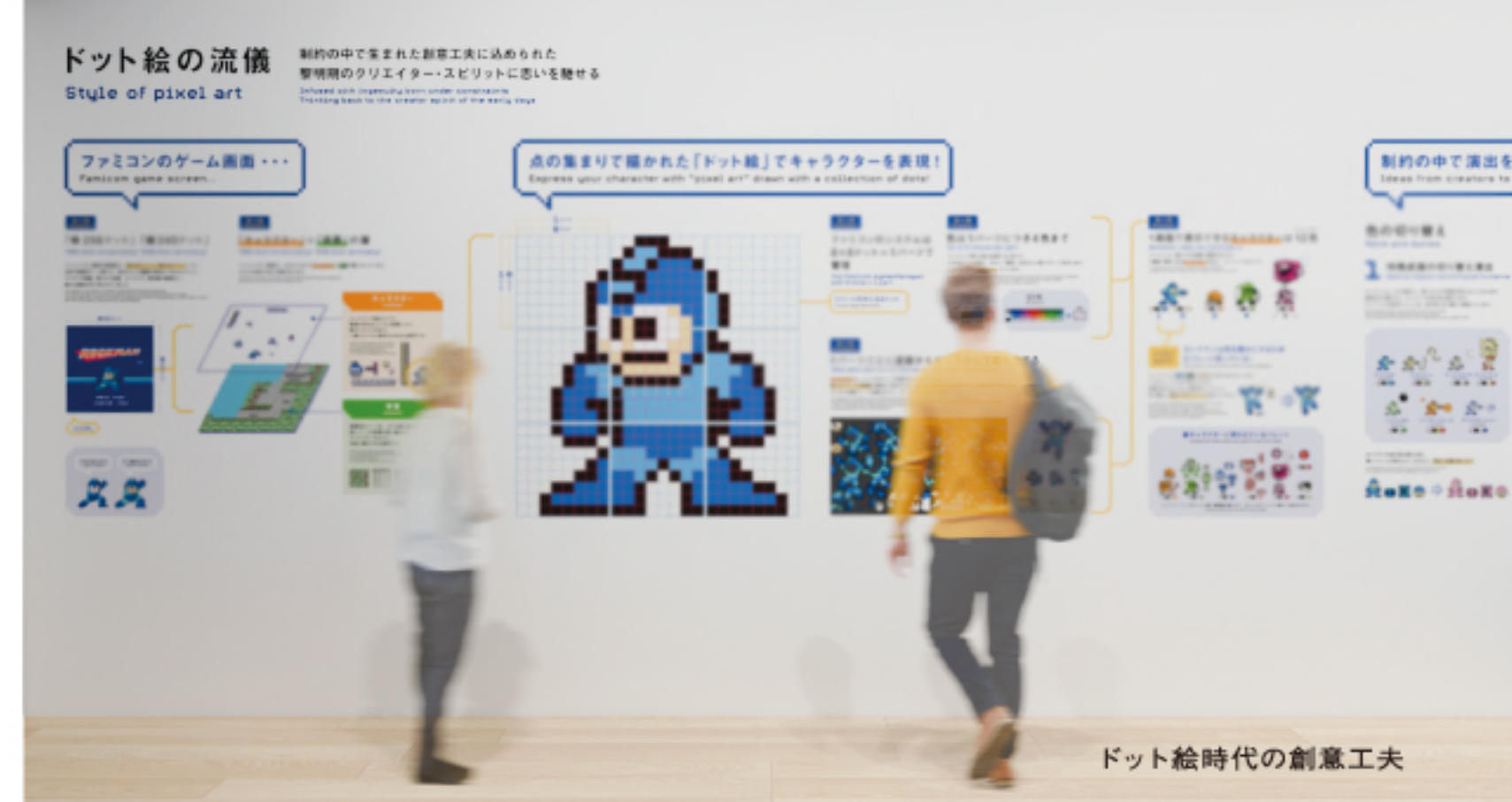
ドット絵時代の創意工夫