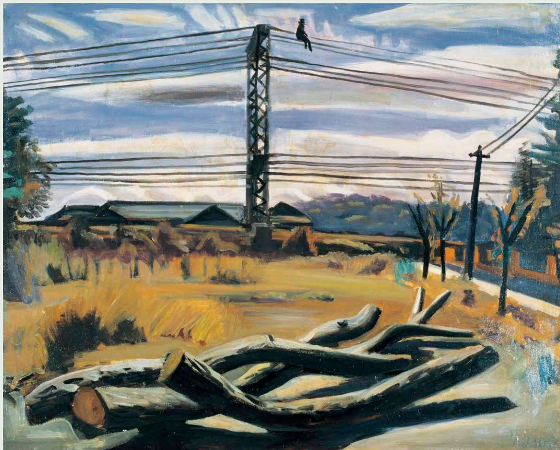
小出 檣重《枯木のある風景》1930年 公益財団法人ウッドワン美術館