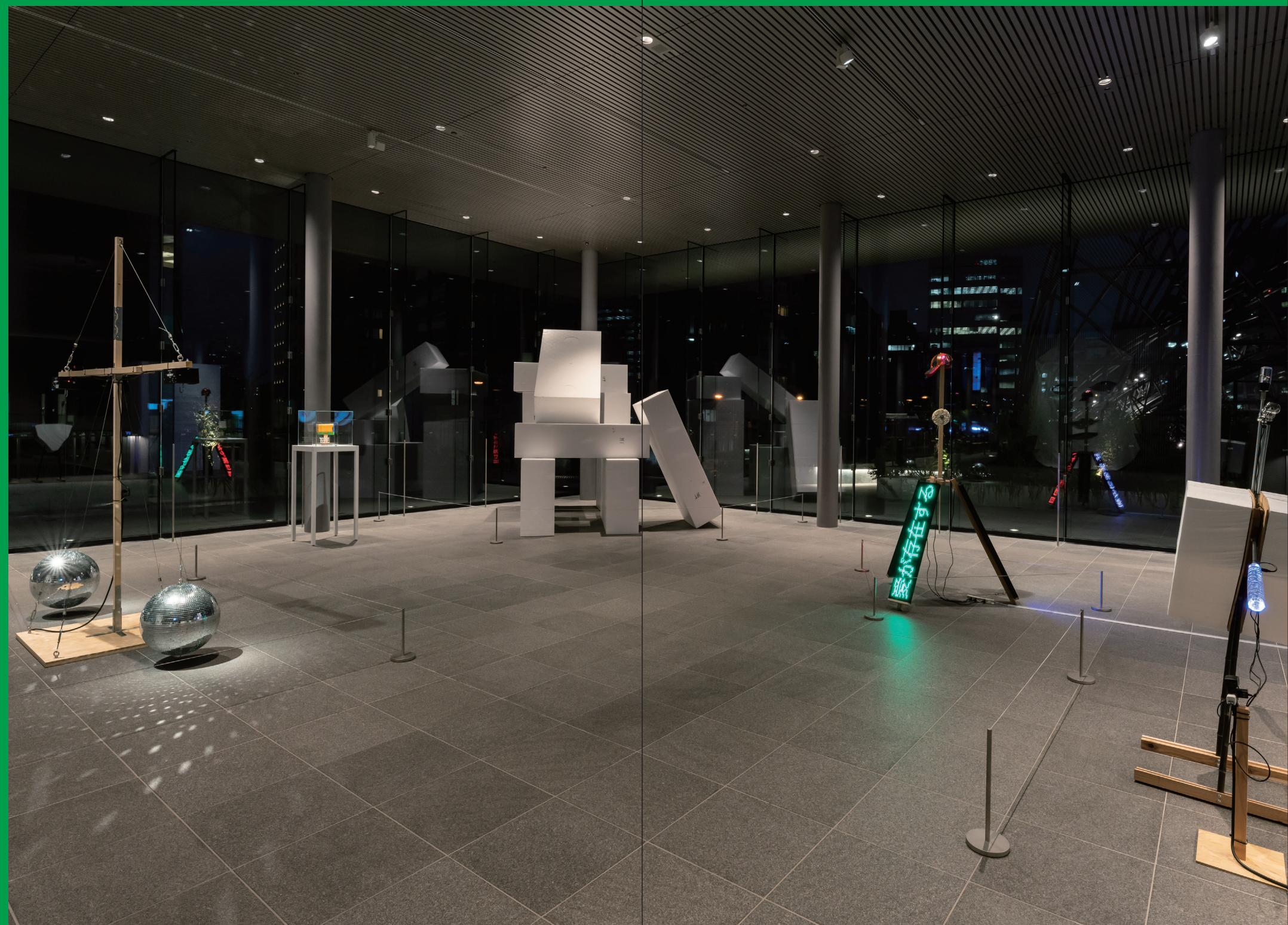
左|《映画スクラップ》2022 右|《フェイスバック》2022