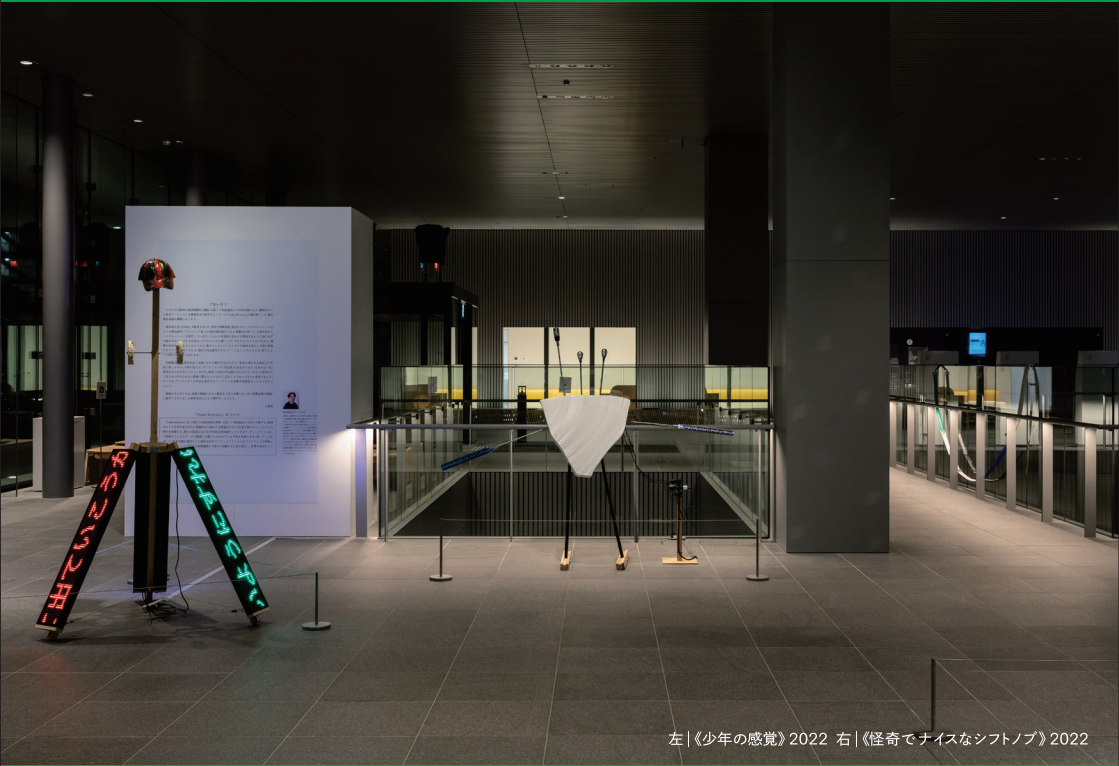
左 | 《少年の感覚》2022 右 | 《怪奇でナイスなシフトノブ》2022