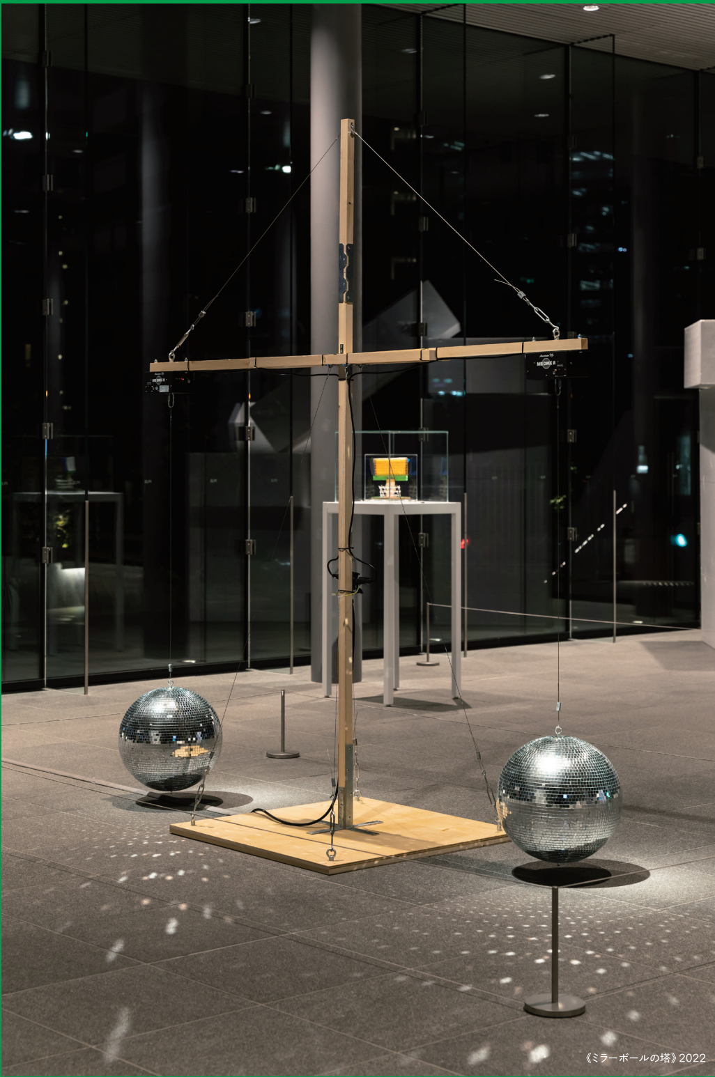
《ミラーボールの塔》2022