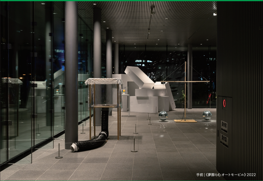
手前 | 《夢膨らむオートモビル》2022