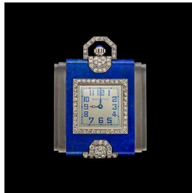
左：ユップ・ヴィールツ 《ヴォーグ、今年の冬の香水はこれだ》 1925年 サントリーポスターコレクション（大阪中之島美術館寄託） 右：ブシュロン《懐中時計》 1930年 ©Boucheron Private Collection