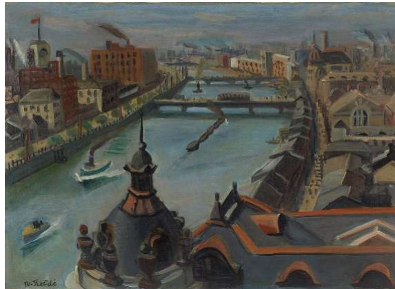
左：小出櫓重 《裸女結髪》 1927年 京都国立近代美術館 右：小出櫓重 《街景》 1925年 大阪中之島美術館