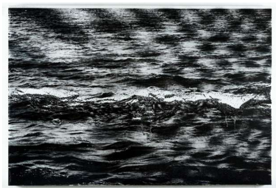
《Seascape/See wave#1》2025年