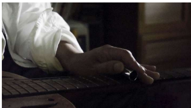
本展のための参考画像 2025年