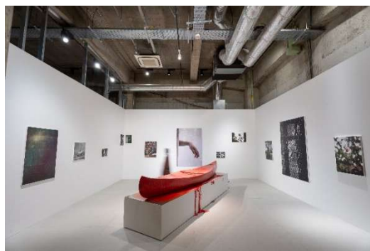
TERRADA ART AWARD 2023 ファイナリスト展 展示風景 Artwork by Mitsuo Kim