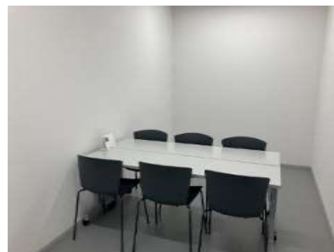
楽屋 1（姿見鏡 1 台有）